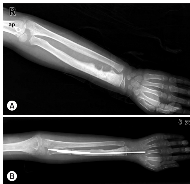
Figure 1. (A) Initial plain radiograph of 6-year-old patient (Case 1) shows osteoblastic lesion with periosteal reaction on distal radius. (B) Wide excision and wrist arthrodesis was done with pasteurized bone and Ender nail.

수술 후 얻어진 종양의 병리학적 괴사 판별은 Huvos의 방법을 따랐으며 90% 이상의 괴사를 보이면 양호, 90% 이하이면 불량한 것